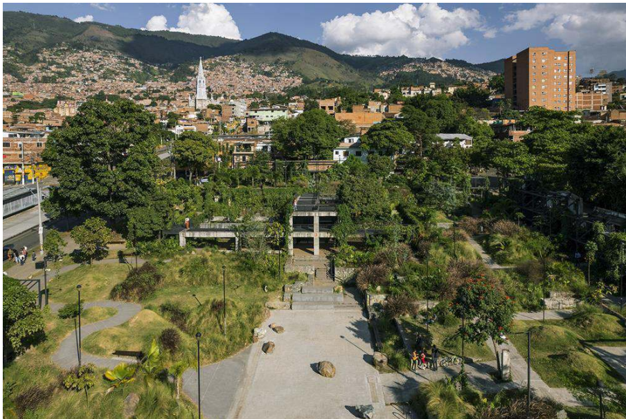
Parque Prado Centro Medellín – Colombia